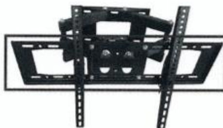
ภาพประกอบแผงรับทีวีขนาด ๕๕ นิ้ว